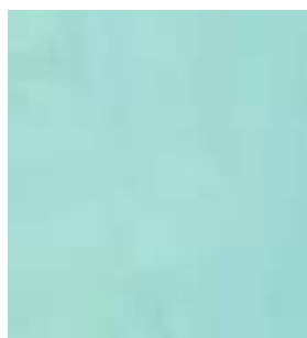
E014 - Esmeralda B