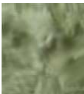
E015 - Olivino