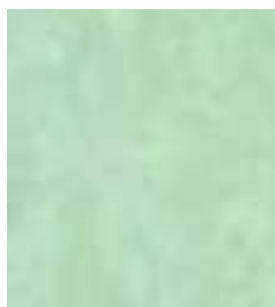
E016 - Olivino B

Estuco Veneciano, compuesto principalmente de cal, polvos pigmentos especiales y aditivos que favorecen el lustrado del producto. Es el clásico Estuco Veneciano utilizado antiguamente, muy elegante y resistente. Estéticamente se presenta como una losa de mármol lisa, compacta y con suaves matices de color.