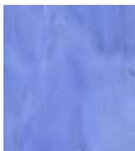
E004 - Zafiro B