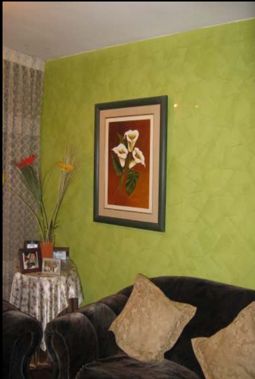
Estuco Veneciano Lustroso, no requiere cera.

Estuco decorativo compuesto principalmente de cal, polvos pigmentos especiales y aditivos que favorecen el lustrado del producto. Es el clásico Estuco Veneciano utilizado antiguamente, muy elegante y resistente. Estéticamente se presenta como una losa de mármol lisa, compacta y con suaves matices de color.