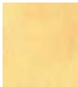
E029 - Blenda B