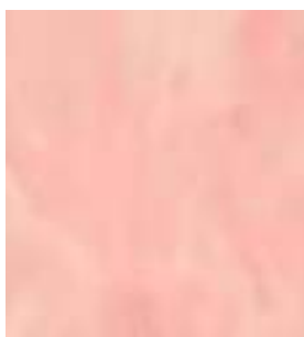
E027 - Hematite B