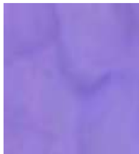
E008 - Amatista B