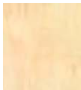
E021 - Opalo B