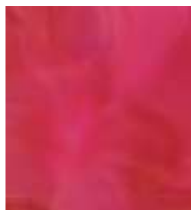
E022 - Rubí