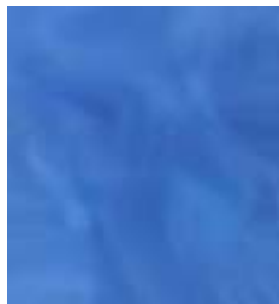
E006 - Circón B