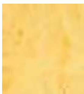
E032 - Ambar