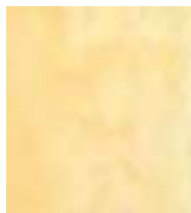
E025 - Rutilo B