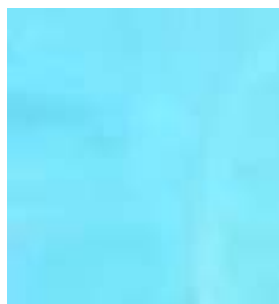
E010 - Turquesa B