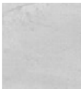
E002 - Agata B