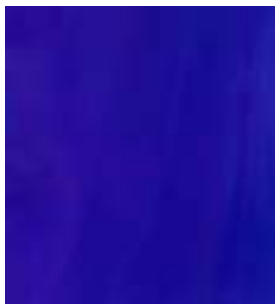
E007 - Amatista