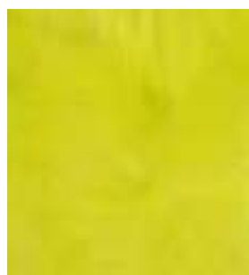
E018 - Jade