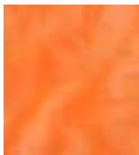
E024 - Rutilo