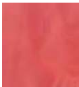
E026 - Hematite